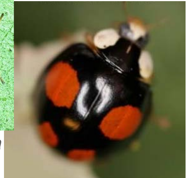
H. axyridis spectabilis