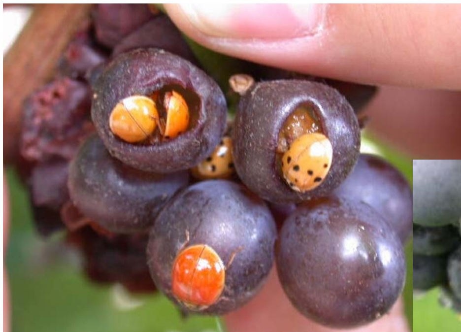
H. axyridis грегарност на гроздју