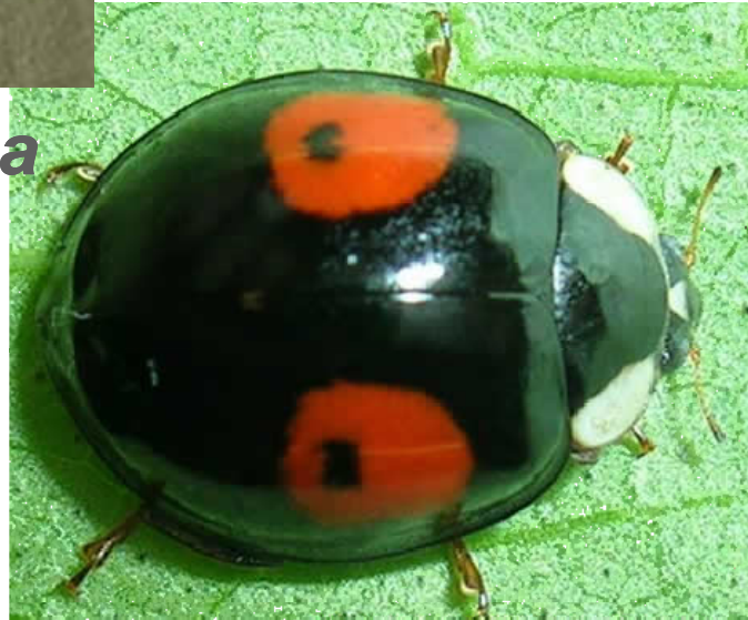
H. axyridis conspicua