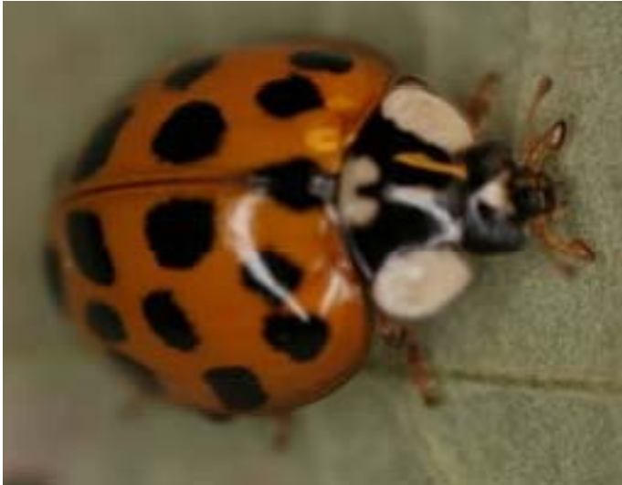
H. axyridis succinea